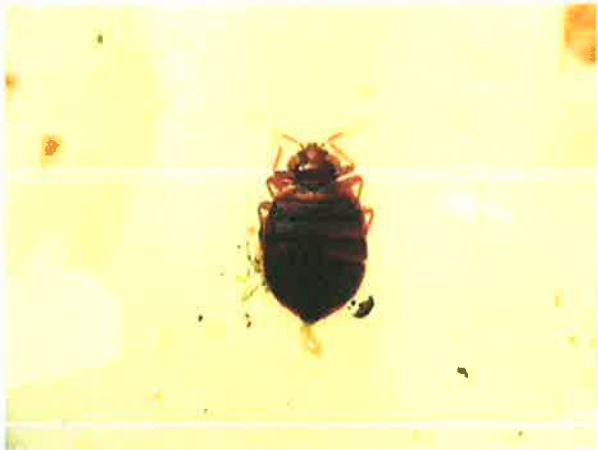
成虫 約5～8mm (下部先端は卵)

トコジラミはシラミの仲間ではありません。別名、ナンキンムシとも言われています。主に夜間に活動して、寝ている人を刺して吸血します。刺傷部位は手足・首などの露出部が多く、くりかえし吸血されることにより痒みが出てきます。あまりの痒さで熟睡することができず精神的にダメージを受ける人がいます。(個人差があります)。